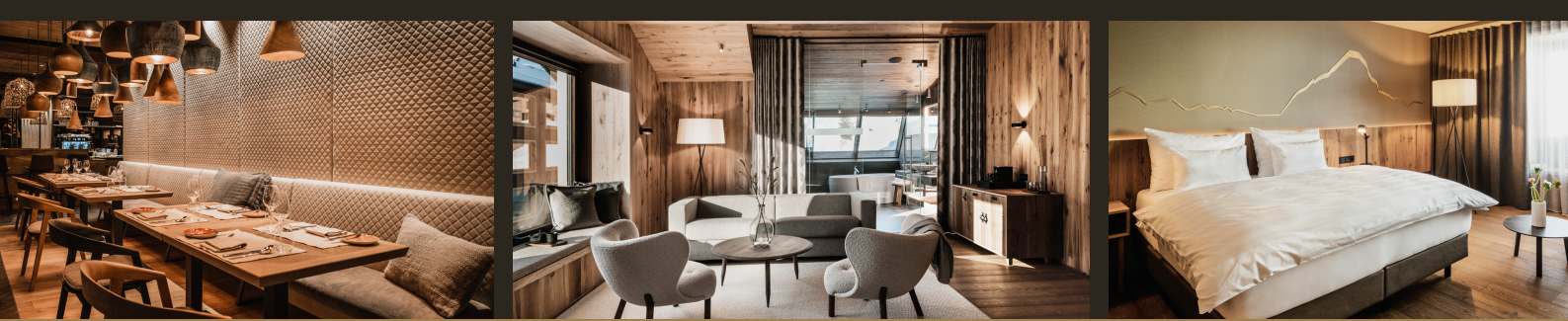
LIFESTYLE HOTEL IN WARTH AM ARLBERG